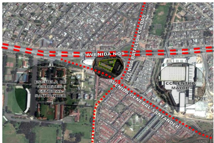
Imagen. 1. localización en el Centro Ampliado Imagen. 2 Localización Restrepo

NORMA APLICABLE: La norma general aplicable a los predios de los proyectos, será la que se encuentre en vigencia al momento del desarrollo del contrato derivado del presente proceso de selección. Ver anexos Técnicos al final de este documento.